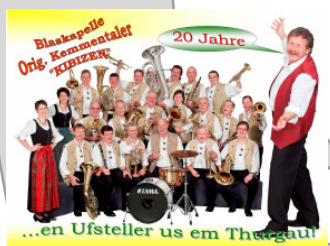
Grosses Blaskapellentreffen Ziehung des Tombola Hauptgewinners