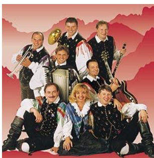
Die jungen Original Oberkrainer